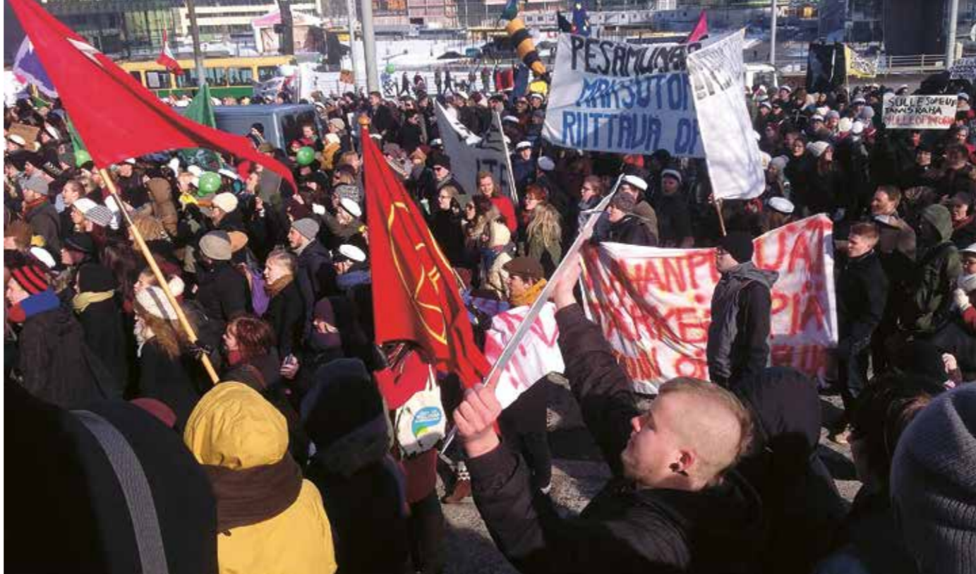
Gatuområdet framför Riksdagshuset är ett lyckat val för demonstrationer riktade till lagstiftarna. Tusentals studenter tog ställning för studiepenningen genom att marschera till Riksdagshuset den 20 mars 2013.

En mera direkt möjlighet för de finländska väljarna att påverka unionens lagstiftning är att de vart femte år får välja Finlands ledamöter i EU-parlamen-