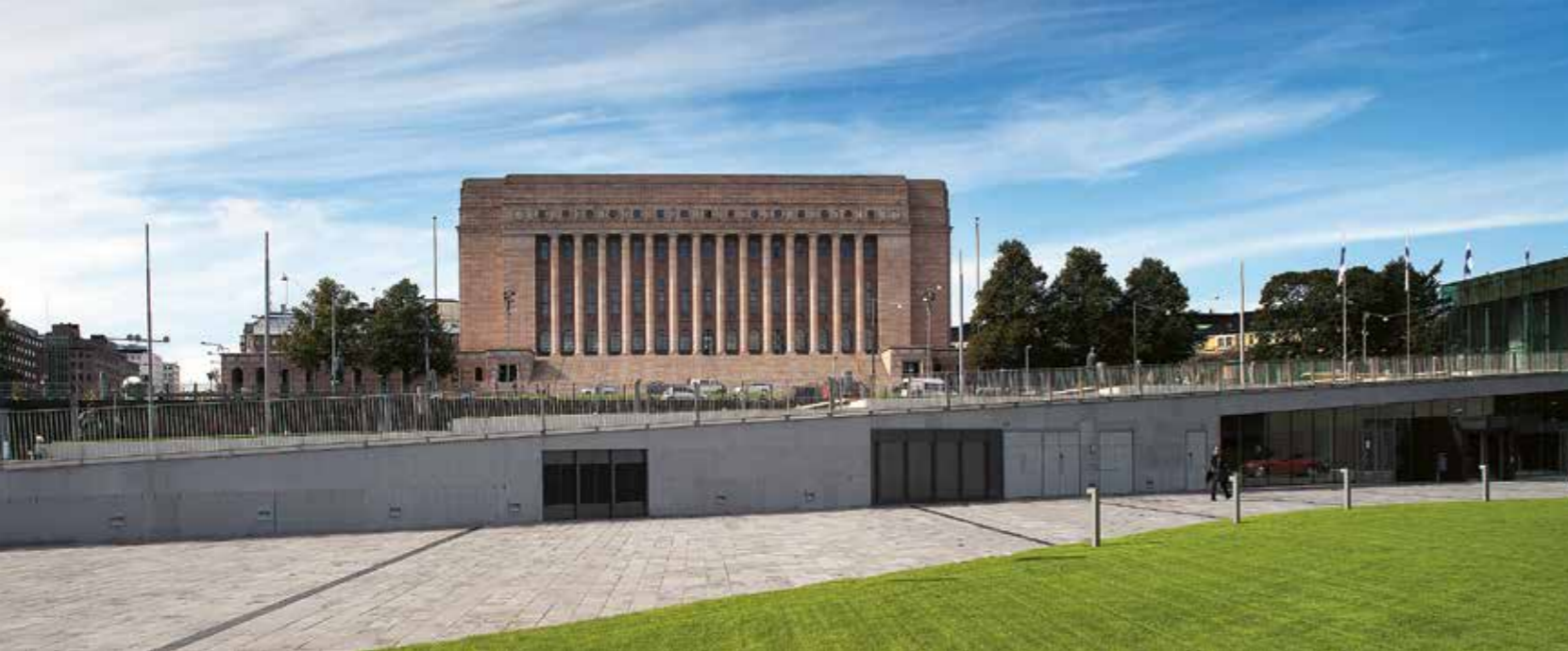
Riksdagshuset invigdes officiellt den 7 mars 1931. Det är ritat av arkitekten Johan Sigfrid Sirén och är fortfarande idag en av de absolut viktigaste symbolerna för landets självständighet och demokrati.

Parlamentarisk demokrati, kallad parlamentarism, har tillämpats i Finland ända sedan år 1919. Under de första decennierna ledde den parlamentariska principen ofta till att regeringarna bara satt i korta perioder. I överbryggandet av de samhällskonflikter som uppkommit som en följd av den statliga självständigheten gällde det att respektera den parlamentariska demokratis spelregler, och till dem hörde även accepterandet av politiska kompromisser. Även det övriga samhället förutsattes ha respekt för på laglig väg fattade beslut, och mot 1930-talets slut hade vår representativa demokrati tydligt visat sin hållfasthet gentemot hotet av olagliga extremrörelser. Det finländska samhället klarade av de tryck som i övriga länder i östliga Europa, i rädsla för kommunismen, hade lett till uppkomsten av olika högerdiktaturer.