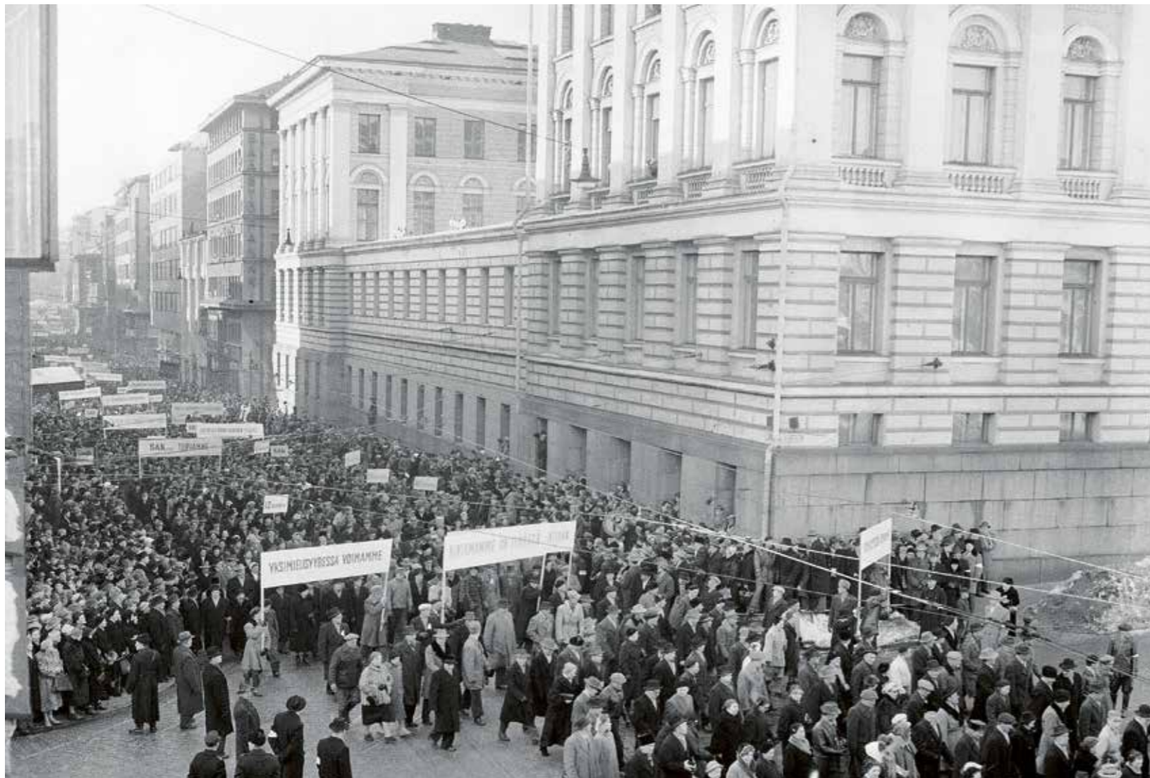
I mars 1956 utbröt en generalstrejk som ett symptom på ett utbrett missnöje i samhället. Strejken tog slut efter att en ny bredbasig regering tillsatts och beslut om betydande löneförhöjningar hade tagits.