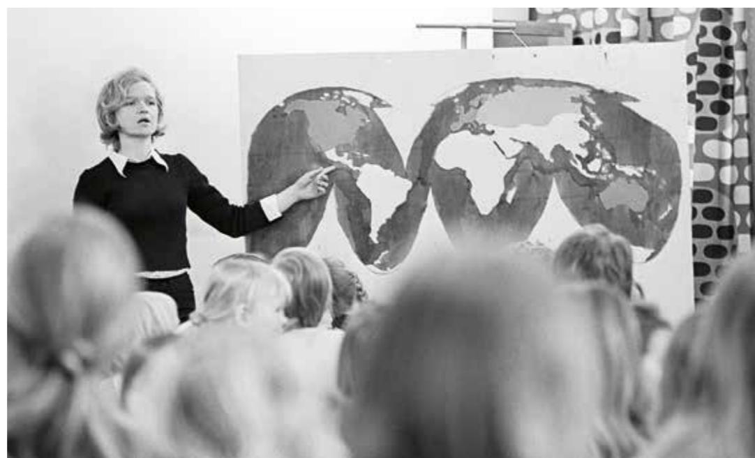
Ett viktigt kännetecken för efterkrigstidens nordiska välfärdssamhället är en stark grundskola. Denna bild är från 1970-talet.

ledde missnöjet till en generalstrejk i flera veckor; för att lösa denna kris behövdes en ny, bredbasig regering och betydande löneyft.