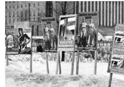
I riksdagsvalet år 1945 sänktes röst-rättsåldern till 21 år, vilket gjorde det möjligt för fler unga krigsveteraner att rösta. I detta val användes även förhandsröstning utomlands för första gången eftersom den från Lappland evakuerade befolkningen var tillfälligt bosatt i Sverige.

Till stöd för förändringarna behövdes dock långsiktiga lösningar av lagstiftarna och utbrett förtroende bland medborgarna för landets politiska system. De besvärligaste faserna inträffade åren 1945-48 och i slutet av 1950-talet. Då visade en stor andel av medborgarna missnöje med riksdagens förmåga att genomdriva reformer, och följden blev utomparlamentariska massrörelser och upprepade strejker. I mars 1956