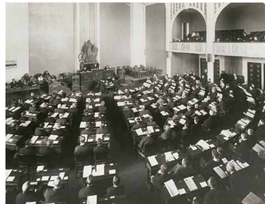
Under åren 1911–1930 samlades riksdagen i Heimolahuset. Bl.a. togs beslut om Finlands självständighetsförklaring år 1917 i detta hus.

stiftade som första åtgärd en ny grundlag, den så kallade regeringsformen, där Finlands statsskick definierades som självständig republik: »Statsmakten i Finland tillkommer folket, som företräds av dess till riksdag församlade representation». Landets utrikespolitik leddes av republikens president, som också hade befogenheter att utnämna regeringen och att upplösa riksdagen. Detta balanserades av att regeringen måste ha stöd av riksdagen: riksdagsledamöterna hade rätt att göra interpellationer för mätning av riksdagens förtroende för regeringen. Om en majoritet i riksdagen då röstade mot regeringen, var denna tvungen att avgå.