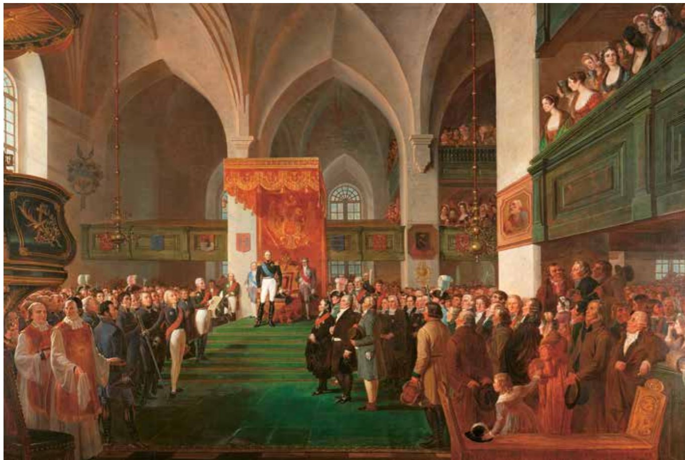
Kejsar Alexander I öppnade Borgå lantdag 1809 och avgav samtidigt sin regentförsäkran. Denna målning är av R. W. Ekman från år 1858.

Grunderna för det för Finland utmärkande politiska systemet och hela vårt samhälle lades under de över 600 år som vårt land utgjorde en del av den svenska staten. Under den här tiden uppstod också det system med representativt beslutsfattande, som flera sekler senare utvecklades till Finlands parlamentariska demokrati med allmän och lika rösträtt som bas. Konungamakten var betydlig, men även konungen var beroende av stödet från undersåtarna i anslutning till viktiga beslut som gällde beskattningen. Detta skedde från och med 1460-talet så att ständerna sammankallades till riksmöte, med representanter för adeln, prästerskapet, borgarna och bönderna. Dessa företrädde dock bara en liten del av hela befolkningen. Det var först från år 1563 som också bönder från Finland var med på riksmötet.