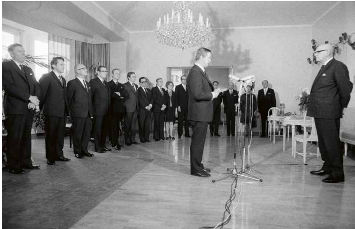
Från år 1966 framöver sköttes skillnaderna i de politiska synsätten med moderata lösningar av bredbasiga regeringar, vilkas kärna fram till mitten av 1980-talet bestod av socialdemokraterna och Centern. På bilden Kalevi Sorsas nya regering på besök hos president Urho Kekkonen på Ekudden den 4 september 1974.

Från år 1966 framöver sköttes skillnaderna i de politiska synsätten med moderata lösningar av bredbasiga regeringar, vilkas kärna fram till mitten av 1980-talet bestod av socialdemokraterna och Centern. Sådana breda regeringskoalitioner över gränslinjen mellan de borgerliga och vänstern har inte just förekommit på andra håll i den kapitalistiska världen. Gränsen mellan höger och vänster överskreds ännu radikalare efter riksdagsvalet våren 1987, när socialdemokraterna och Samlingspartiet tillsammans bildade den så kallade blå-röda koalitionsregeringen. Under de senaste årtiondena har regeringsbaser över skiljelinjen höger-vänster blivit alldeles vanliga; efter den nämnda blå-röda regeringen har det i Finland bara två gånger förekommit rent borgerliga regeringar, nämligen under riksdagsperioderna 1991–1995 och 2007–2011.