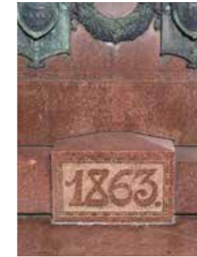
Alexander II:s staty på Senatstorget i Helsingfors är även ett minnesmärke för 1863 års lantdag.