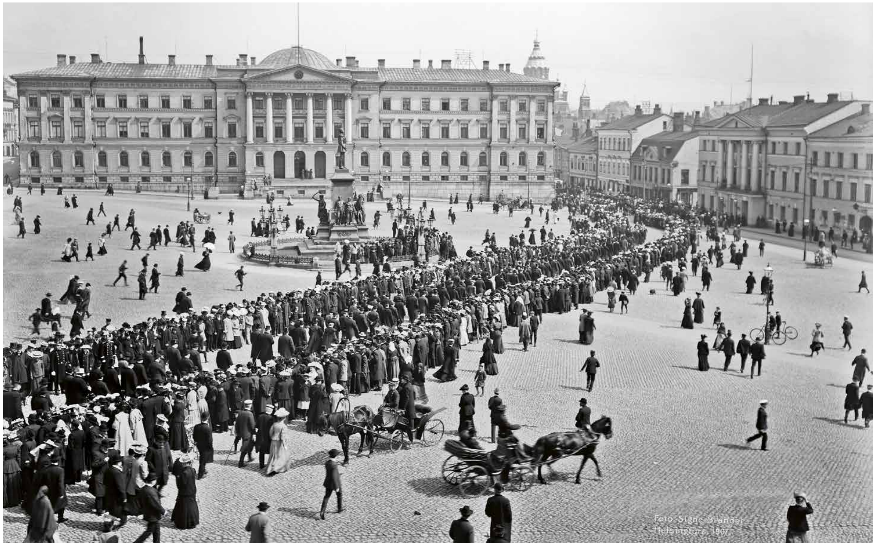
Helsingfors, 1907.