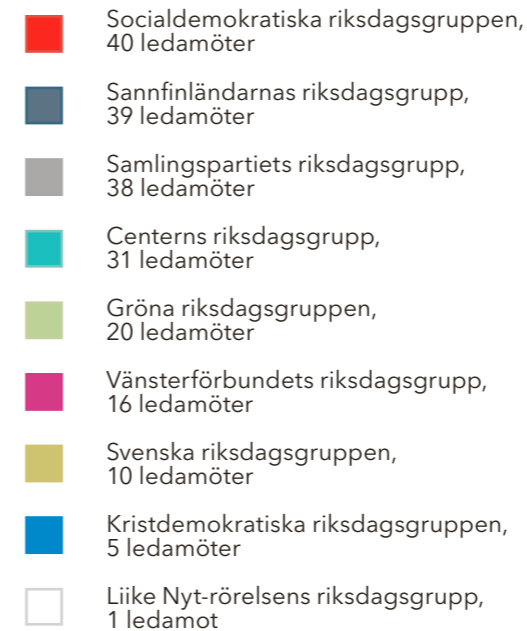
Riksdagens sammansättning 2019

Som väljare kan du följa vad din ledamot säger och gör. Allt som ledamoten säger i plenisalen tas upp och går ut i riksdagens webbsändningar och in i plenarprotokollet. Nästan alla ledamöter har dessutom sina egna webbsidor och är aktiva i sociala medier.