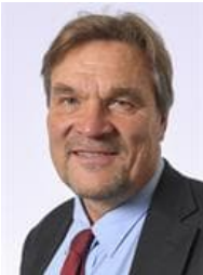
Kimmo KILJUNEN (SDP)