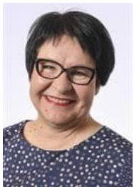
Tarja FILATOV (SDP)